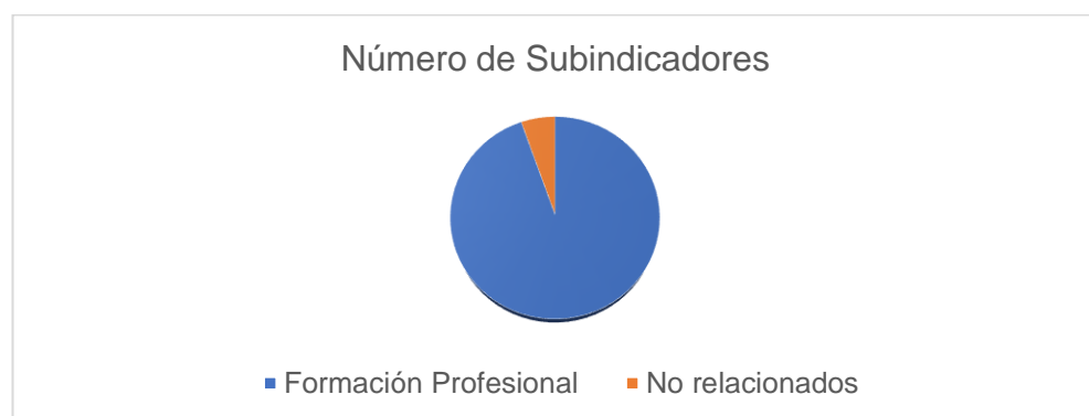
Figura 1. Resultados del Trillaje.

Al aplicar el método de Trillaje descrito anteriormente, se encontraron 37 subindicadores, de los cuales 35 tienen relación directa con la formación.